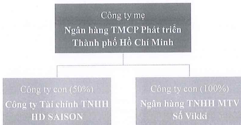
Hình 1: Cơ cấu tổ chức của HDBank