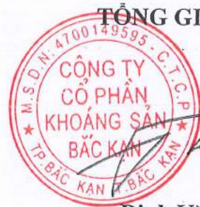
Đình Văn Hiến