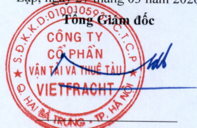
Đào Nguyên Đặng