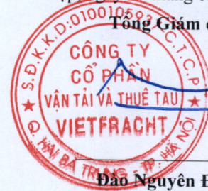
Đào Nguyên Đặng