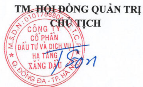
Trương Hùng Sơn