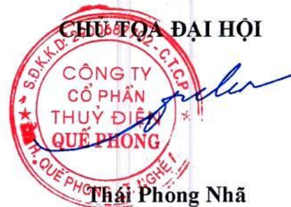
Thái Phong Nhã