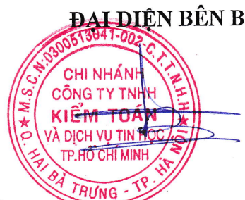
PHẠM XUÂN SƠN