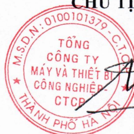
Trần Quốc Toàn