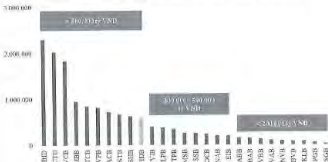
Biểu đồ 1: TTS của 27 NHTM niêm yết/Upscom, không tính Agribank