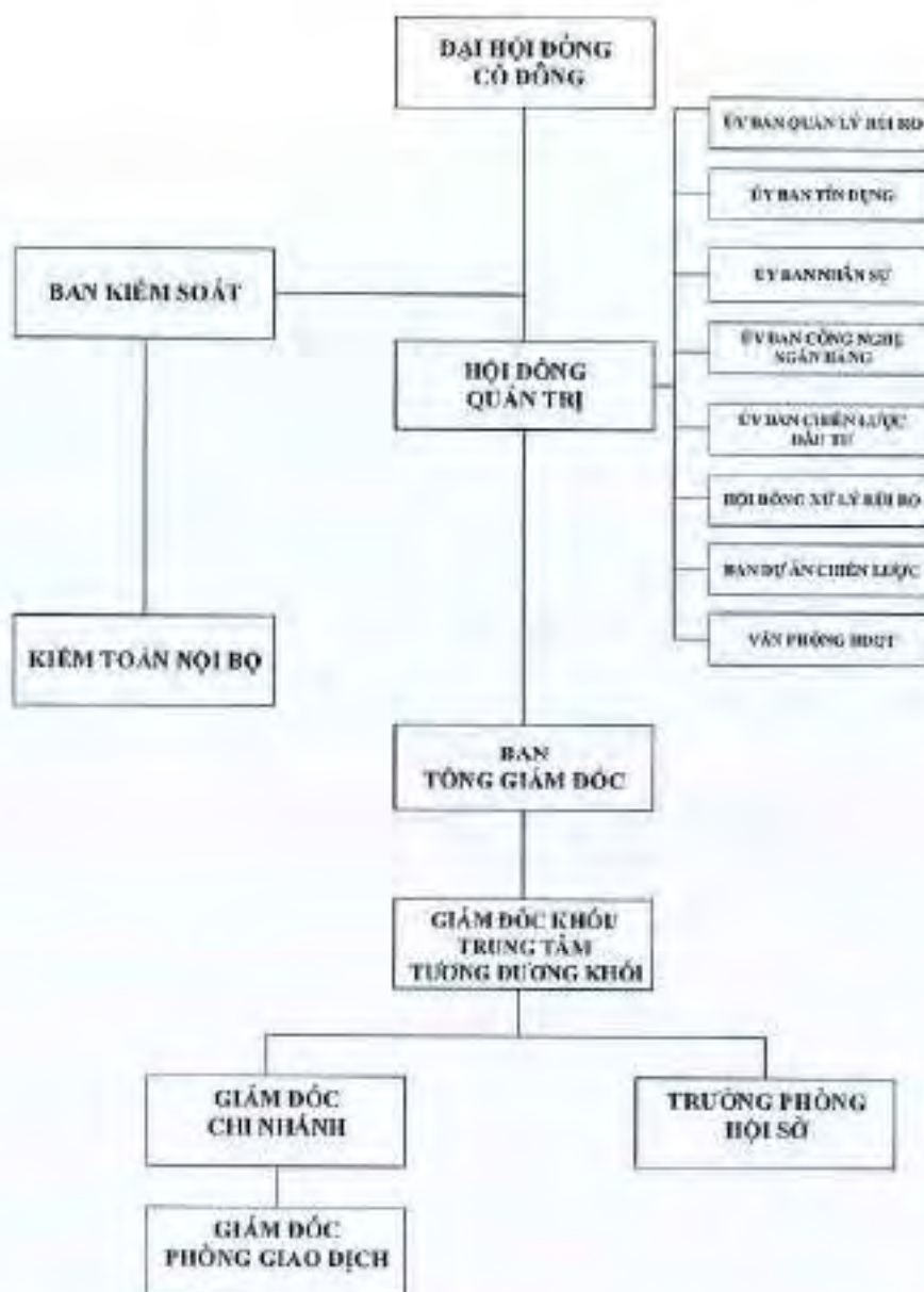
Hình 2: Cơ cấu bộ máy quản lý của HDBank.