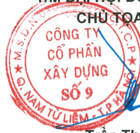
Trần Thạch Tân