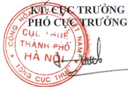
Viên Viết Hùng