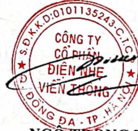
NGÔ TRỌNG VINH