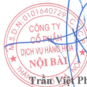
Trần Việt Phương