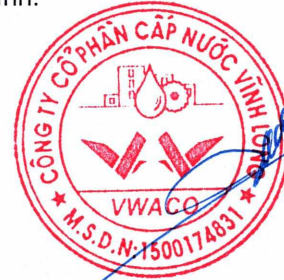
Đặng Tấn Chiến Chủ tịch