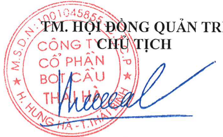
NGÔ TIẾN CƯỜNG