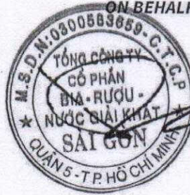
Koh Poh Tiong