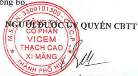
Ngô Quốc Việt