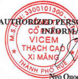
Ngô Quốc Việt