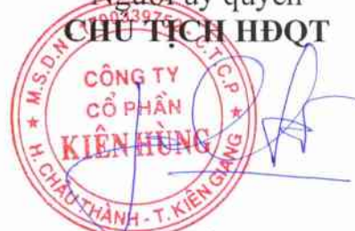
Trần Quốc Hùng