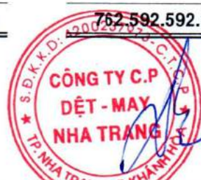
ĐẶNG VŨ HÙNG