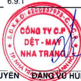
ĐANG VŨ HÙNG