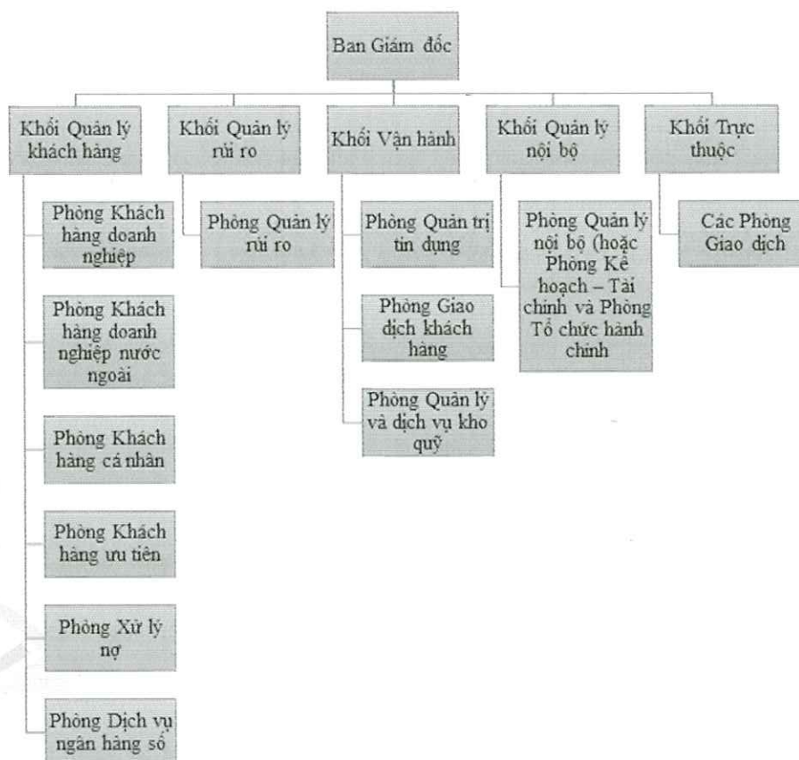
Hình 3: Mô hình tổ chức các chi nhánh của BIDV

Cơ cấu tổ chức thông thường của chi nhánh bao gồm Ban Giám đốc và các Khối chức năng giúp việc cho Ban Giám đốc như sau: