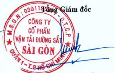
THAI VĂN TRUYỀN