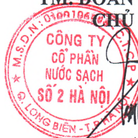
Dương Quốc Tuấn