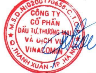
Thiều Quang Thảo