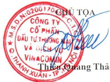
Thiều Quang Thảo