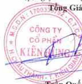
Trần Quốc Dũng