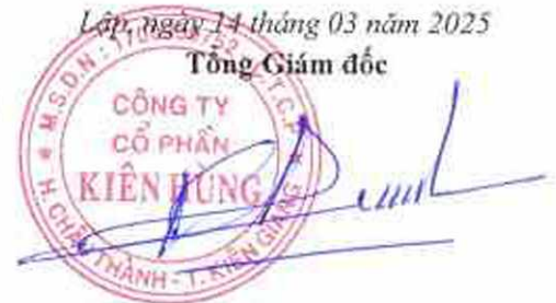
Trần Quốc Dũng