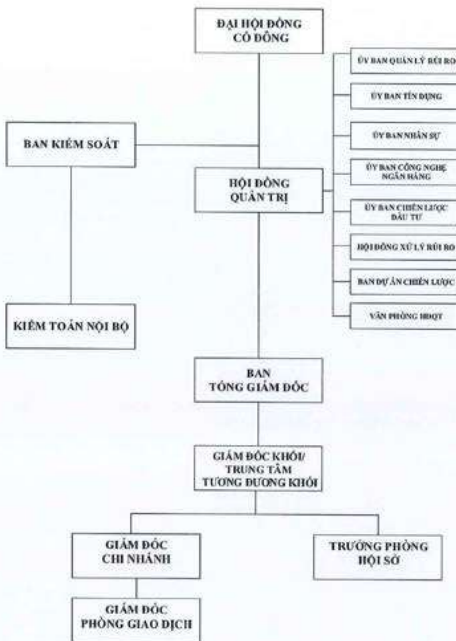
Hình 2: Cơ cấu bộ máy quản lý của HDBank