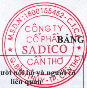
BẢNG 1: DANH SÁCH NGƯỜI NỘI BỘ