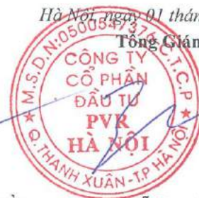
Đỗ Duy Điền