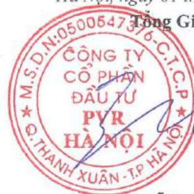
Đỗ Duy Điền