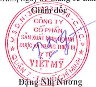
Đặng Nhật Nương