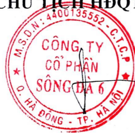
Đặng Quốc Bảo