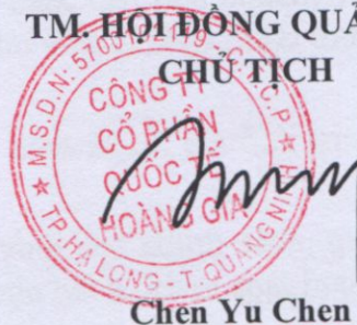
Chen Yu Chen