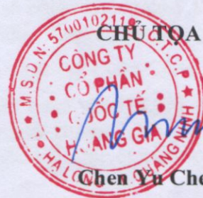
Chen Yu Chen