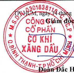
Đoàn Đắc Học