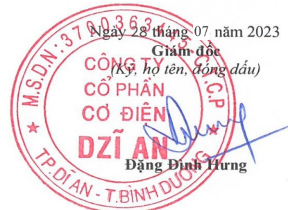
Trương Trúc Quyên