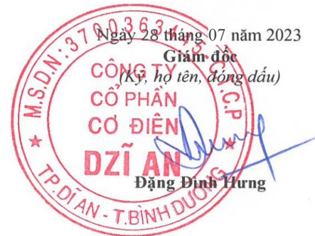
Trương Trúc Quyên