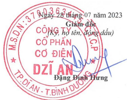
Trương Trúc Quyên