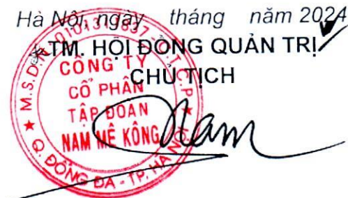
Kiều Xuân Nam