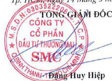
Đặng Huy Hiệp