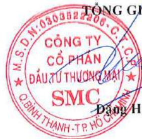
Đặng Huy Hiệp