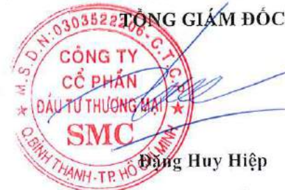
Đặng Huy Hiệp