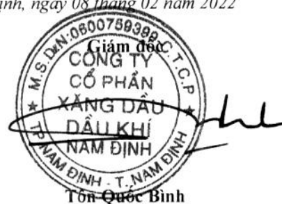
Tôn Quốc Bình