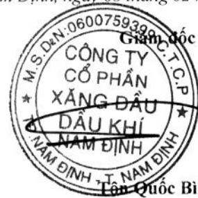
Lên Quốc Bình