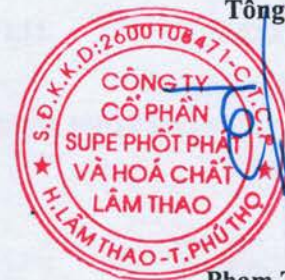
Phạm Thanh Tùng

(Các thuyết minh từ trang 10 đến trang 35 là bộ phận hợp thành của Báo cáo tài chính tổng hợp này)