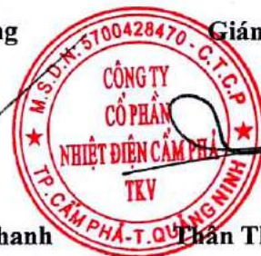
Trần Thế Đăng