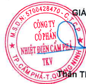
Thần Thế Đăng