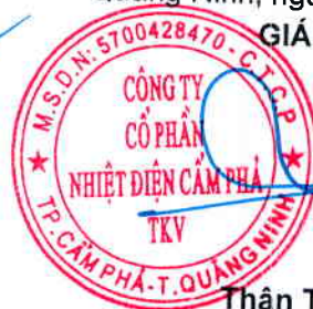
Thân Thế Đàng