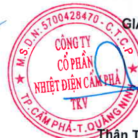
Thân Thế Đăng