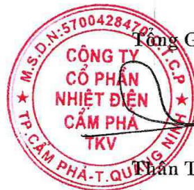
Thần Thế Đăng