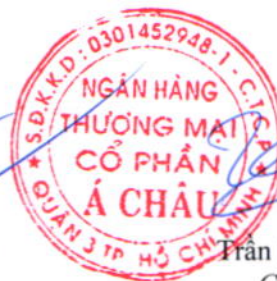
Trần Hùng Huy Chủ tịch