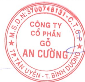
Lê Đức Nghĩa Chủ tịch Hội đồng Quản trị Ngày 28 tháng 3 năm 2024

Các thuyết minh từ trang 10 đến trang 56 là một phần cấu thành báo cáo tài chính hợp nhất này.