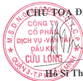
Hồ Sĩ Thuận