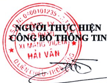
Đinh Ngọc Châu

Chúng tôi xin cam kết các thông tin công bố trên đây là đúng sự thật và hoàn toàn chịu trách nhiệm trước pháp luật về nội dung thông tin đã công bố.