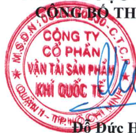
Đỗ Đức Hùng