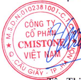
Tôn Thiện Việt Chủ tịch HĐQT