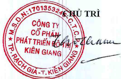
Ông Trần Thọ Thắng