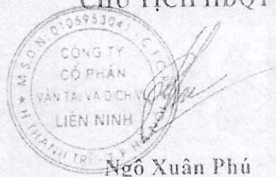
Ngô Xuân Phú