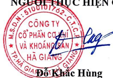
Đỗ Khắc Hùng