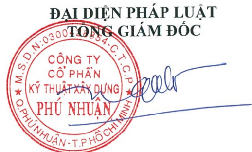
Ngô Như Hùng