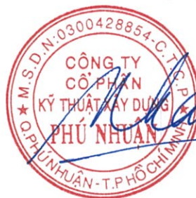
DƯƠNG DŨNG NHÂN