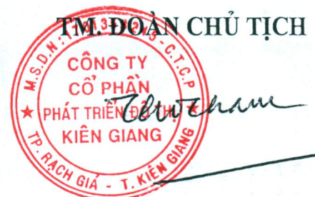
TRẦN THỌ THẮNG