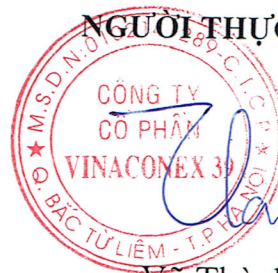
Vũ Thành Kiên